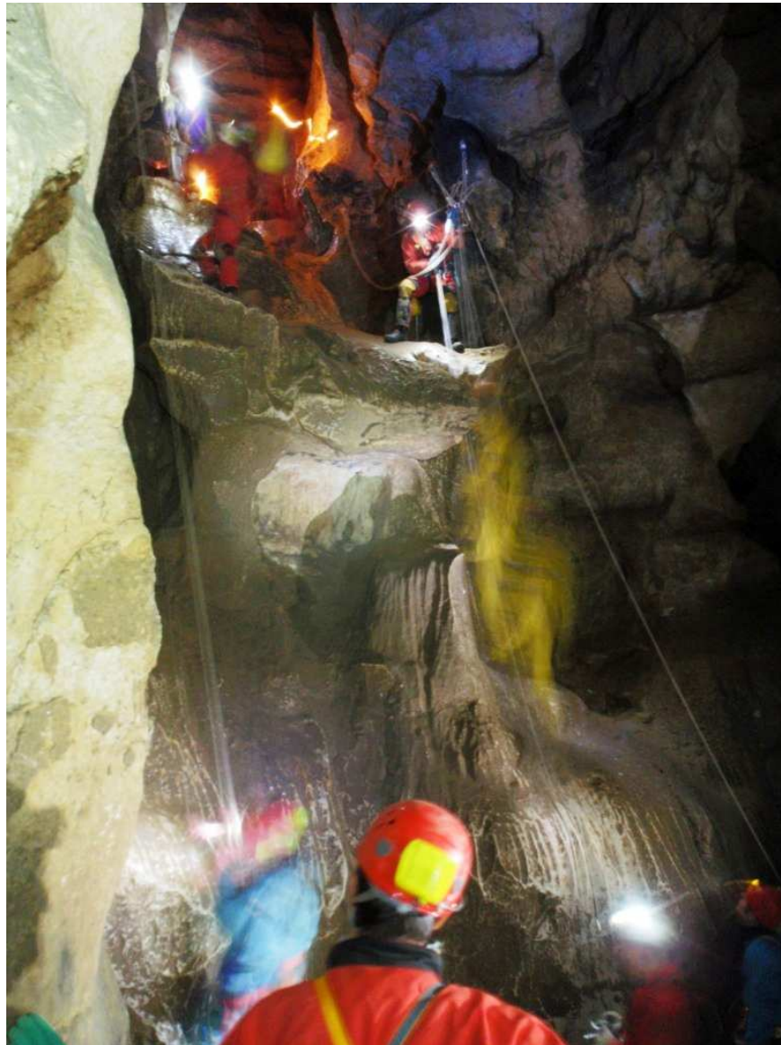
Les Cavottes – Doubs

Maison lorraine de la spéléologie à Lisle-en-Rigault (55)