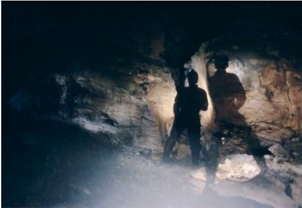
Gouffre de la Belle Louise

Revue du Comité Spéléologique d'Ile de France Organe décentralisé de la Fédération Française de Spéléologie