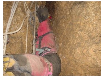
Exploration dans le Doubs