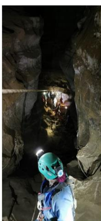
La civière remonte le P7 sur une tyrolienne équipée en partie avec des PULSE.